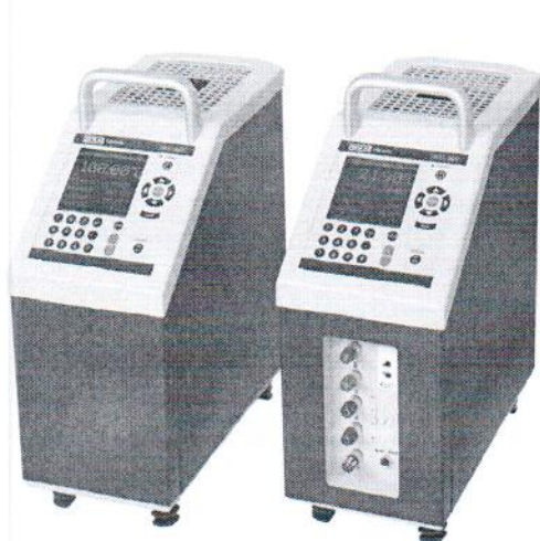
CTD9300-650, CTD 9300-165

Внешний вид калибраторов представлен на рисунке 1. Место нанесения знака поверки (клейма-наклейки) приведено в приложении А.